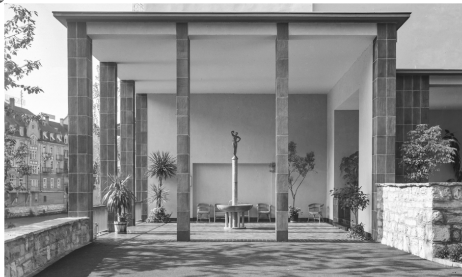
Oben: Kurbrunnenanlage von Hans Trudel mit Skulptur «Die Badende» auf der Brunnensäule.