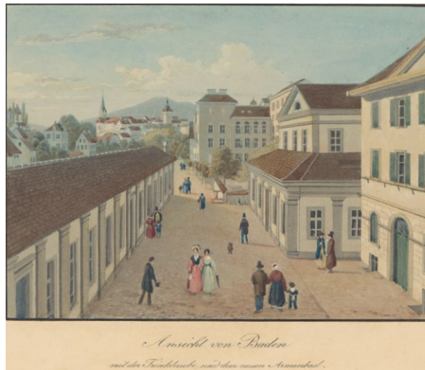
Die 1836 erstellte Trinklaube (links) gleicht dem heutigen Inhalatorium. Aquatinta: Jakob Mayer-Attenhofer 1840.